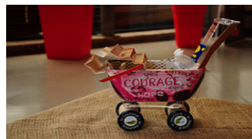
Bébé-nature - Charlie-Rose Arsenault, École Saint-Barthélemy

Mention de source pour les photos suivantes : Oxfam-Québec