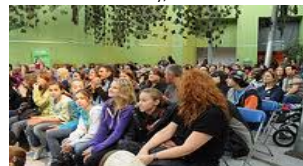
Un gala haut en couleurs