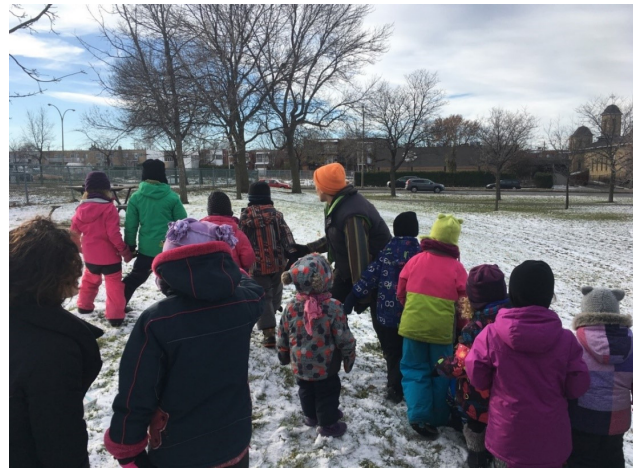
Les élèves en compagnie d'un animateur du programme Coyote se dirigent discrètement vers un arbre où se trouve un épervier.

Au programme, huit sorties, soit deux escapades par saison, dont la moitié vouée au verdissement et à l'embellissement de parcs urbains, soit : corvée dans le quartier, participation ponctuelle au Champ des possibles, récolte de graines sur le mont Royal, germination et repotage d'arbrisseaux dans le cadre du programme Semences d'avenir. L'autre moitié des activités consiste à faire de l'exercice physique au cœur de la nature : randonnée pédestre, sortie en raquettes, descente de rivière en canot et visite d'une grotte!