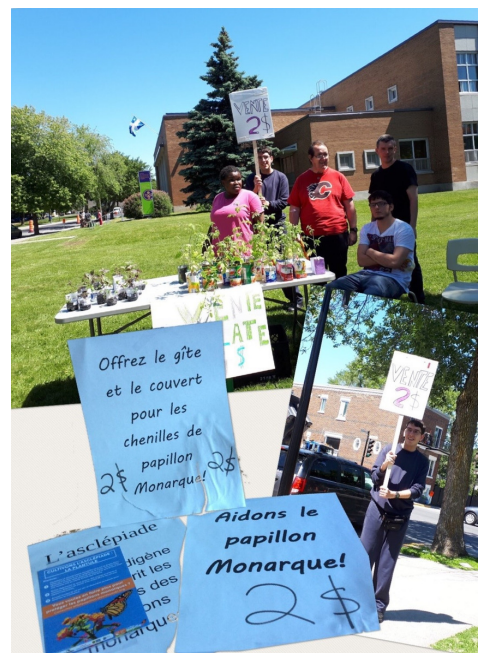
Photo : un élève du centre Montage : Chantal Boudreau, conseillère pédagogique, CREP

La production en jardins verticaux permet d'approvisionner en fines herbes les élèves du « volet Cuisiner ». Les apprentissages réalisés en « agriculture urbaine » sont transférables à la maison ce qui fait rayonner le projet en dehors des murs du centre. De plus, tous les élèves du CREP sont encouragés à protéger l'environnement.