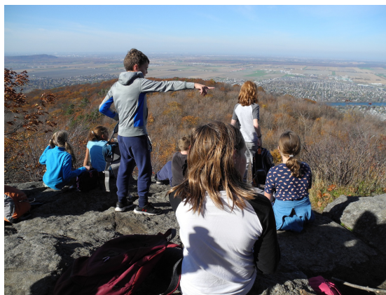
Randonnée pédestre au mont St-Hilaire

Ce projet cultive la fierté des élèves et des bénévoles à faire partie du Club et leur permet de tisser des liens avec la communauté. Une subvention a été obtenue et une version bonifiée du projet est déjà officiellement sur les rails pour l'année 2018-2019.