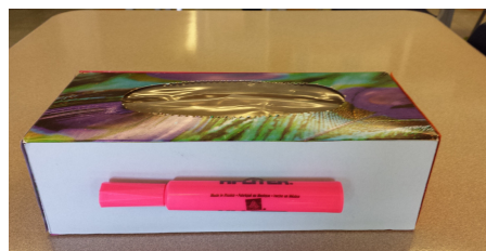
Collecte des crayons en plastique

Monsieur Réal Arsenault est venu rencontrer les élèves en classe puisqu'il ramasse les attaches à pain et les goupilles pour la Fondation de l'hôpital Maisonneuve-Rosemont. Les élèves ont trié