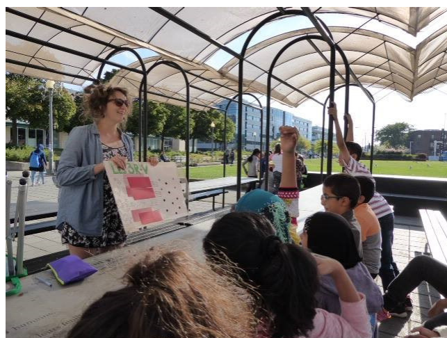
Des élèves de l'école Barthélemy-Vimont participent à un atelier sur les 3RV avec Geneviève Albert de l'éco-quartier Parc-Extension.