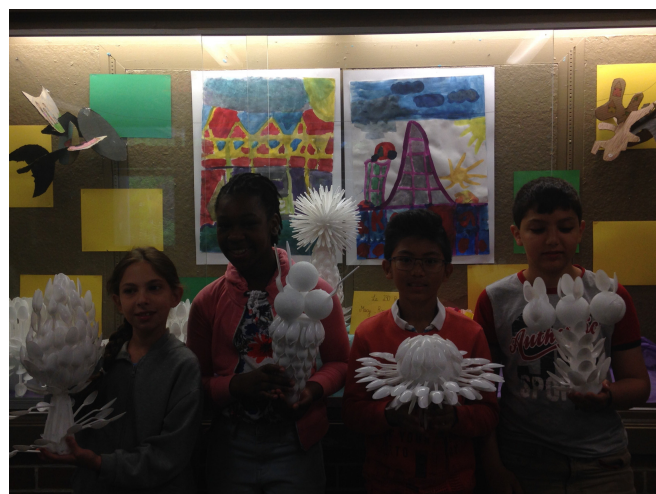
Œuvres élaborées à partir de cuillères.