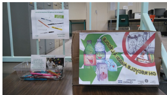
Une boîte qui récupère les contenants et une boîte qui récupère les stylos

Dans les deux projets, chaque année, la quantité de matières détournées de la poubelle est en constante augmentation.