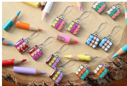
Récupération des crayons de bois de couleur pour une bijoutière.