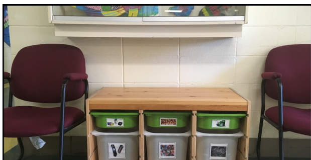
Point de collecte situé dans l'entrée de l'école près du secrétariat.