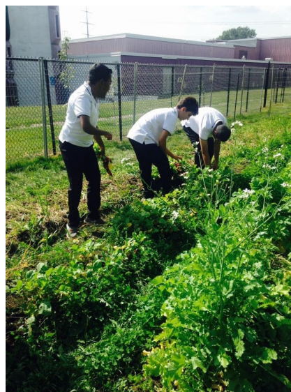
Séance de jardinage avec élèves de FPT, foyer 807-808