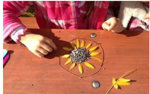
Une enfant s'adonnant au land art au parc des Royaux

Lors des sorties, la prise de risque est adaptée au stade de développement des enfants. Cette année, quatre classes et trois groupes du service de garde ont suivi les traces des trois classes initiales et participent au compostage, un autre beau volet de ce projet!