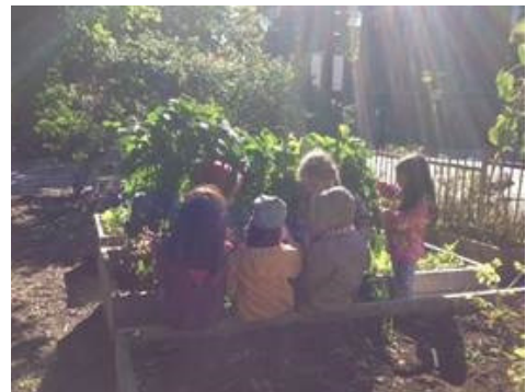
Des élèves de maternelle à la recherche de haricots à récolter dans le jardin collectif situé à côté de l'école.