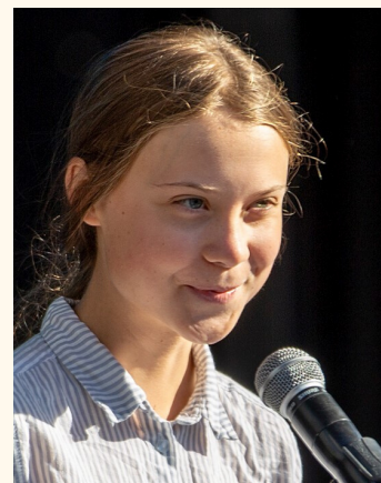
Greta Thunberg, à la Marche pour le climat du 27 septembre 2019, à Montréal.

Pour réaliser des projets environnementaux ou une gestion écologique des matières résiduelles, la formation de comités verts est un atout