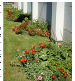
Aménagement paysager devant le CREP