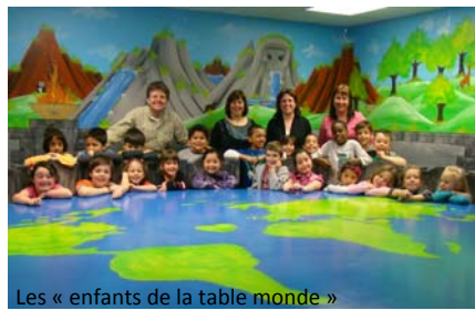
Les « enfants de la table monde »