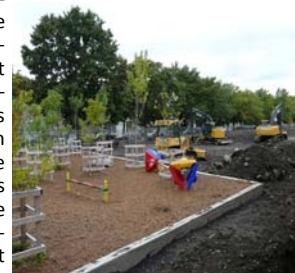
Début des travaux dans la cour de l'école Saint-Bernardin

Les changements climatiques engendrent d'importants bouleversements des écosystèmes à l'échelle planétaire. Les systèmes urbains sont particulièrement vulnérables, et les effets s'y font durement sentir. Sans aucun doute, le modèle actuel de développement urbain est en cause. En plus de créer des îlots de chaleur en été, les vastes étendues de béton et d'asphalte génèrent de sérieux problèmes de gestion des eaux et de santé. Lorsqu'il y a des pluies intenses et fréquentes, les réseaux unitaires de collecte et d'assainissement des eaux usées débordent. Ces déversements dégradent inévitablement la qualité des eaux des milieux récepteurs (lacs et rivières).