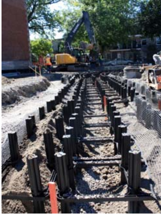
Installation des cellules Silva, école Saint-Clément.

Nous sommes maintenant à la fin de cette grande aventure et nous voulions communiquer les résultats fort impressionnants des aménagements, qui sont tous en voie d'être terminés au cours des prochaines semaines. Tout d'abord, l'aménagement de la cour de l'école Saint-Clément (quartier Hochelaga-Maisonneuve) a donné lieu à une grande première au Québec grâce à l'installation d'une série de cellules Silva . Cette technologie innovatrice permettra aux arbres de mieux se développer. Utilisée depuis plusieurs années en Ontario, en Colombie-Britannique et dans plusieurs régions américaines, la cellule Silva sera donc expérimentée pour la première fois au Québec. Ces cellules assurent aux racines des arbres une meilleure croissance et empêchent le sol de se compacter. Ainsi, cela permettra à la cour de cette école d'atteindre son îlot de fraîcheur plus rapidement. C'est grâce à une mobilisation sans précédent et dans un esprit de collaboration entre la direction de l'école et tous les intervenants associés à ce projet que cet ambitieux aménagement a pu voir le jour. De plus, la cour servira de modèle pour mesurer l'impact du verdissement sur les îlots de chaleur en collaboration avec Environnement Canada.