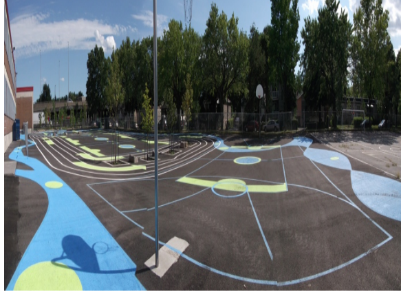
Cour de l'école Saint-Bernardin