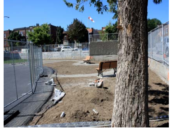
Création des espaces de plantation, école Notre-Dame-de-l'Assomption.

L'aménagement de la cour de l'école Saint-Bernardin (quartier Villeray -Saint-Michel) est terminé, et le résultat est également impressionnant et des plus colorés. Dans le cadre de ce projet, les arbres ont été plantés dans des fosses en tranchée avec sol structurant. Cela donnera des conditions favorables à la croissance des arbres tout en permettant une meilleure gestion des eaux de pluie.