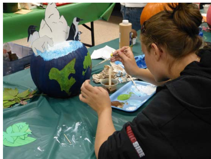
Une élève du centre Marie-Médiatrice