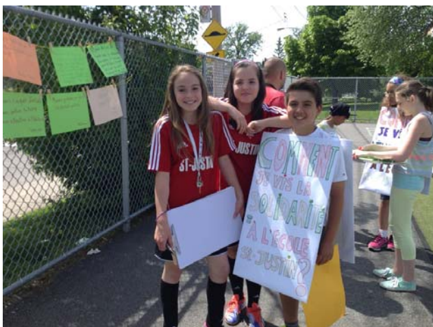
Des élèves à l'œuvre