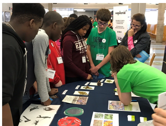
Salon des exposants