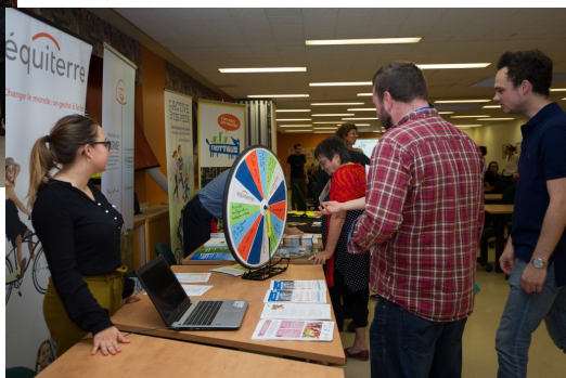
Le salon des exposants