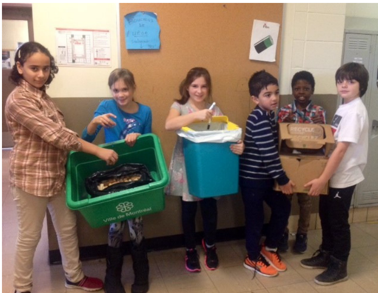
Des élèves à l'œuvre

Françoise Maréchal Enseignante École Saint-Justin